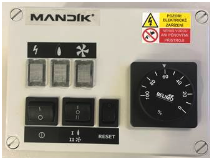
Steuerschrank MC (PRIS-AUTO-1178) mit Drehpotentiometer zur stufenlosen Leistungseinstellung