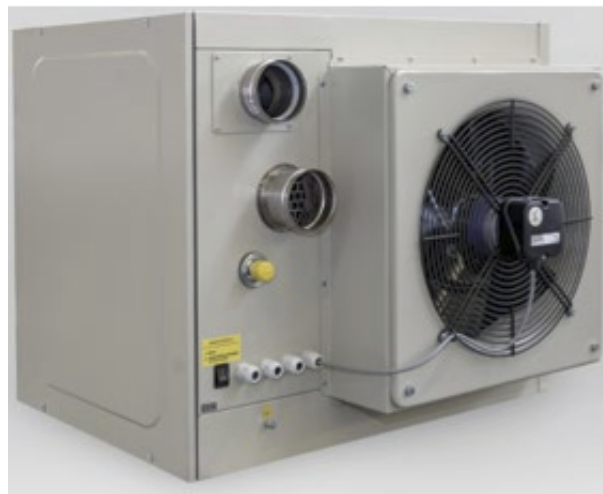
Rückseite im Profil